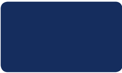
NACHTBLAU NIGHT BLUE BLEU NOCTURNE I RAL 5022