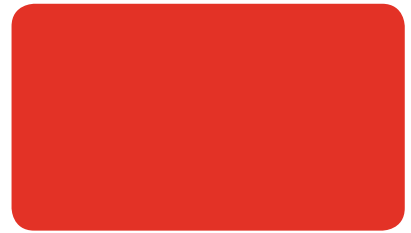
BLUTORANGE VERMILION ORANGÉ SANG