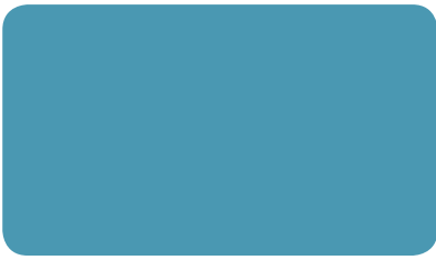
PASTELLBLAU PASTEL BLUE BLEU PASTEL I RAL 5024