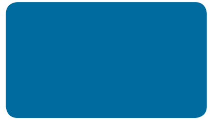
VERKEHRSBLAU TRAFFIC BLUE BLEU SIGNALISATION I RAL 5017