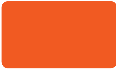
VERKEHRSORANGE TRAFFIC ORANGE ORANGÉ SIGNALISATION