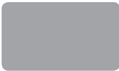
VERKEHRSGRAU A TRAFFIC GREY A GRIS SIGNALISATION A I RAL 7042