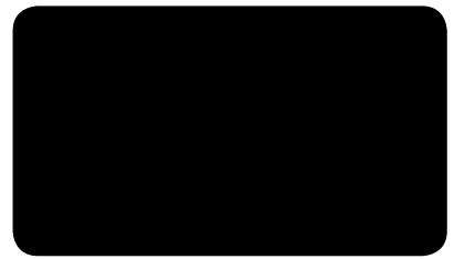
VERKEHRSSCHWARZ TRAFFIC BLACK NOIR SIGNALISATION I RAL 9017