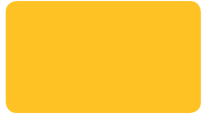
SIGNALGELB SIGNAL YELLOW JAUNE DE SÉCURITÉ