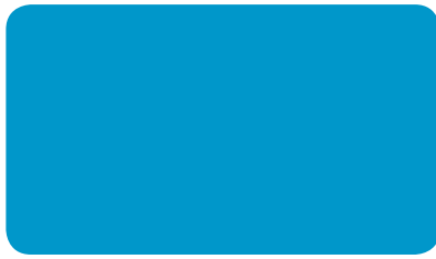
LICHTBLAU LIGHT BLUE BLEU CLAIR I RAL 5012