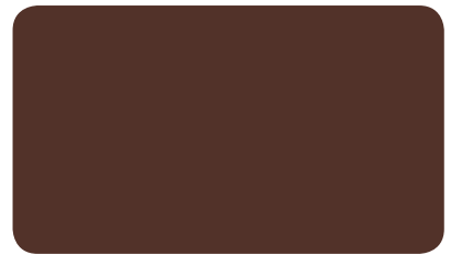
SCHOKOLADENBRAUN CHOCOLATE BROWN BRUN CHOCOLAT