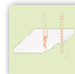
CNC-fräsen / spanlos Schneiden